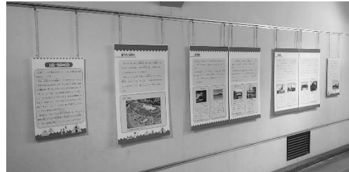
パネル展「原始・古代の住居」展示風景

内容：原始・古代の建物である竪穴住居や高床倉庫、祭殿などについて、床（生活面）を持ち上げる高床式と、そうではない竪穴式（平地式）の2通りに分けて紹介。それぞれの様式の利点はどこにあるのか、現在見ることができる建物からアプローチした展示。