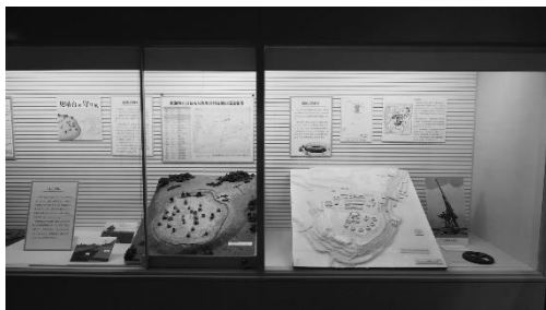
「見晴台の守り展」展示風景