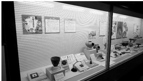
「見晴台遺跡展－見晴台で暮らした人々－」展示風景