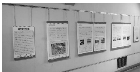
パネル展「原始・古代の住居」展示風景

内容：原始・古代の建物である竪穴住居や高床倉庫、祭殿などについて、床（生活面）を持ち上げる高床式と、そうではない竪穴式（平地式）の2通りに分けて紹介。それぞれの様式の利点はどこにあるのか、現在見ることができる建物からアプローチした展示。