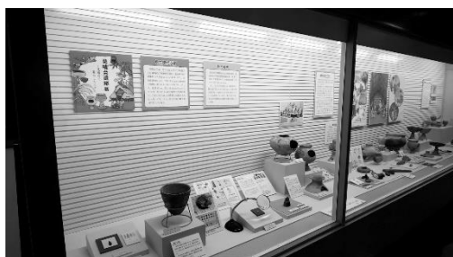
「見晴台遺跡展－見晴台で暮らした人々－」展示風景