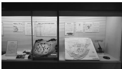
「見晴台の守り展」展示風景