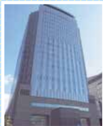
NHK名古屋放送センタービル