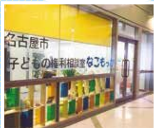
なごもっか入口 (6階です)

なごもっかはみなさんが自分の意見を言えるように話を聞き、ともに考え、みなさんの気持ちを尊重した解決を目指します。