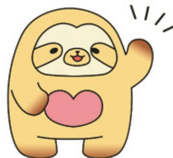
マスコットキャラクター 「なごもん」