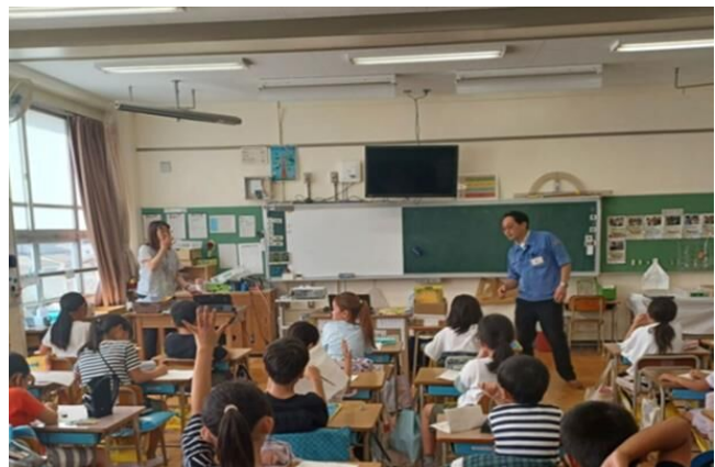
小学校にて出前授業を実施