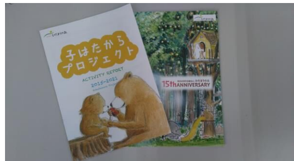
NPO法人 ひだまりの丘へ寄付をしています