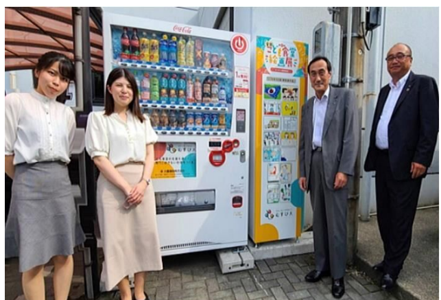
こども食堂支援自動販売機を設置