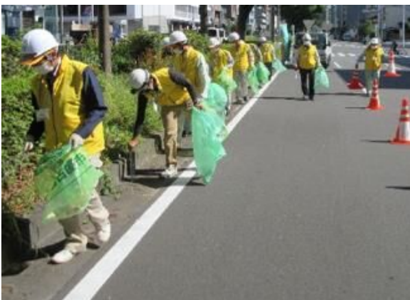
環境ボランティア活動