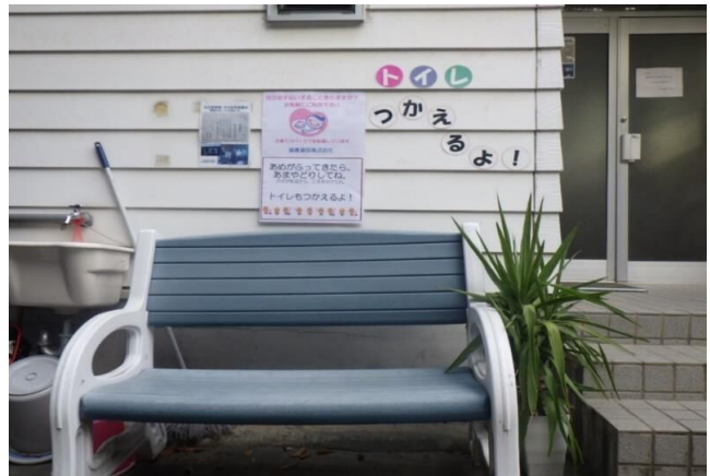
トイレ貸し出・ベンチの設置