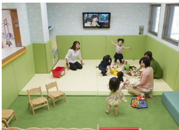
親子で楽しく過ごせるキッズルーム