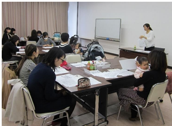
復職前セミナーの様子 (現在はWebで開催)