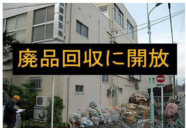
子供祭りや廃品回収に駐車場解放