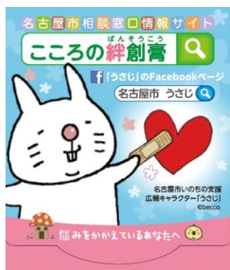
【携帯用絆創膏（こころの絆創膏）】