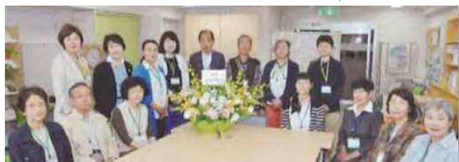
ピアサポーターの皆さん

ピアネットには同じような体験をもつがんのピアサポーターがいます。 ひとりで悩まないで、まずは、ピアネットに相談してみませんか？