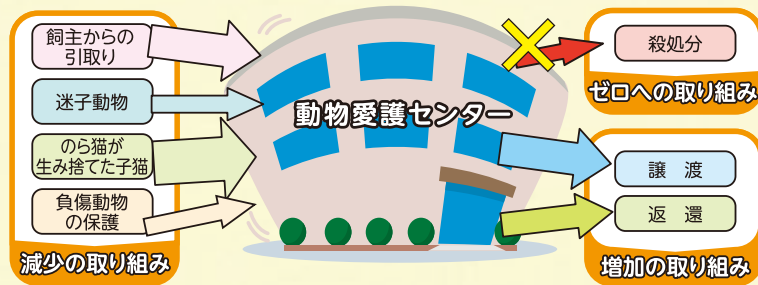
動物愛護センターのイメージ図

犬猫に関わる多くの方々と共に取り組みを進めることで、平成28年度に達成した犬の殺処分ゼロを維持するとともに、猫においても1日も早い殺処分ゼロの達成を目指しています。