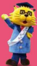
名古屋市動物愛護センター マスコットキャラクター ワンニャン博士