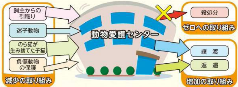
動物愛護センターのイメージ図

また、多頭飼育崩壊の防止やのら猫の避妊去勢手術の推進など収容頭数を減らす取り組みにも力を入れています。取り組みの詳細はプロジェクトサイトでご紹介しています。