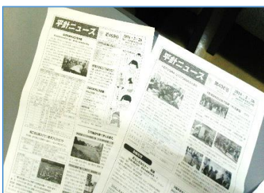
今回は記念すべき第500号！！

紙面には「コミセン産直朝市」「ふれあい給食・配食」「地域支えあい」「お助け・見守り」「スイセン復活プロジェクト」などのタイトルが並び、活動の多様さがうかがえます。地域の話はたいがい「あ、平針ニュースに載っていたアレね」で通じることが多いそうです。