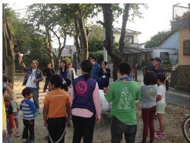
＜正色公園清掃活動の様子＞