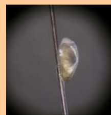
アタマジラミの卵