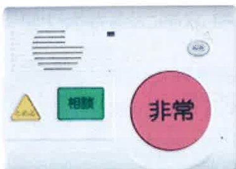
あんしん電話機本体