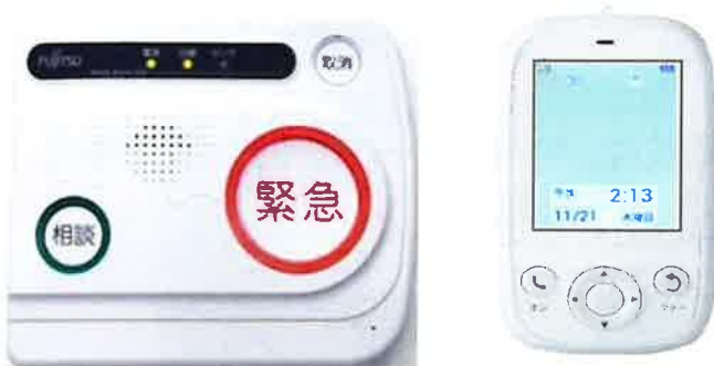
あんしん電話機本体もしくは 携帯型あんしん電話機