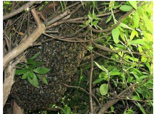
ミツバチの分蜂群