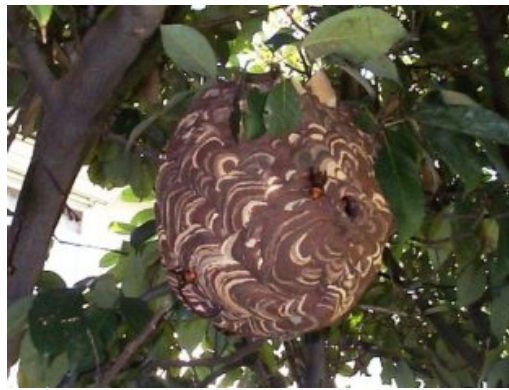
大きくなった巣(8月以降)