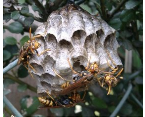
アシナガバチの巣