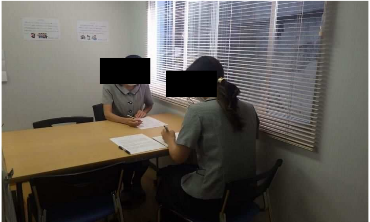
社内にて相談窓口となる従業員による、1:1のメンタリングを実施している