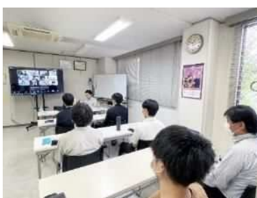
在宅メンバーとの オンライン会議の様子