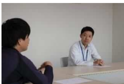
←パパ座談会の様子