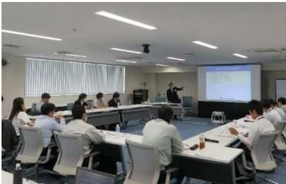
社内キャリア研修実施時の様子②