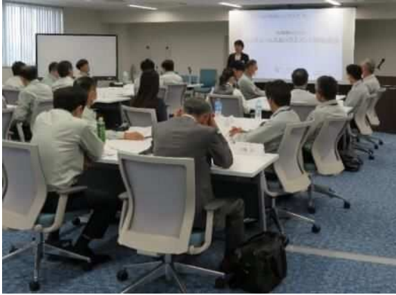
ハラスメント研修開催時の様子