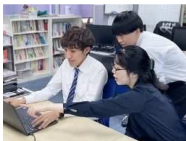
社内新人研修の様子