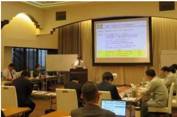
社内キャリア研修実施時の様子①