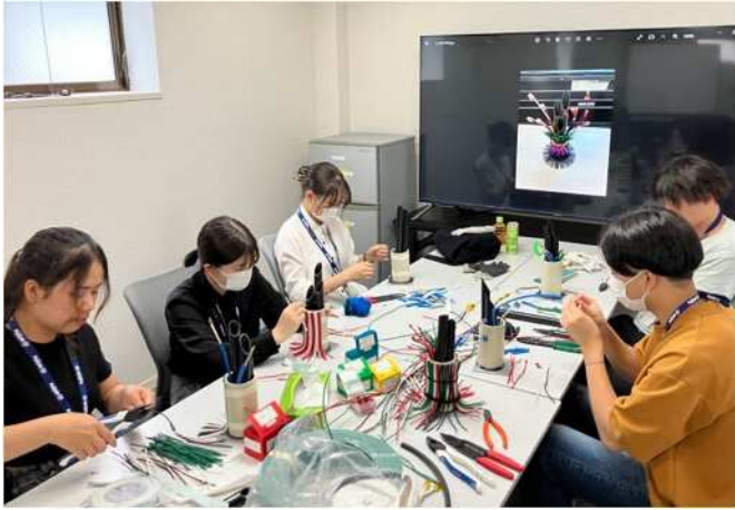
インターンシップの様子 学生に電気工事で使用する工具や材料に慣れ親しんでもらうため、工作を行なっている様子