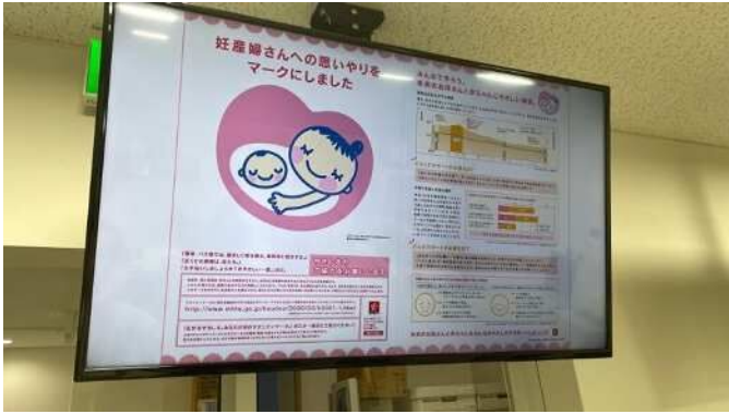
社内サイネージの様子 社会的取り組みや社内規定など、社員向けの案内を日々表示し、周知・浸透させている。