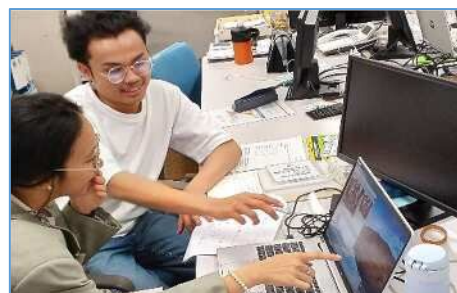
インターンシップ職場体験