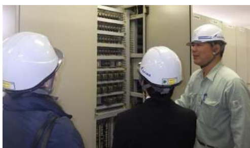
インターンシップ実施