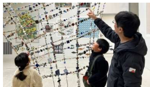
有休休暇時の家族のふれあい