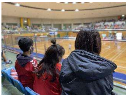
プロスポーツを親子で観戦