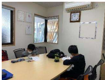
『職場参観』を兼ね、夏休みなどに会議室を従業員の子どもに開放