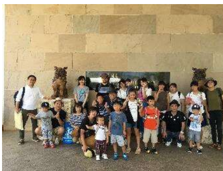
従業員家族を招待して親睦旅行