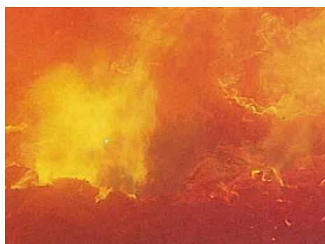
ごみを燃やしている様子