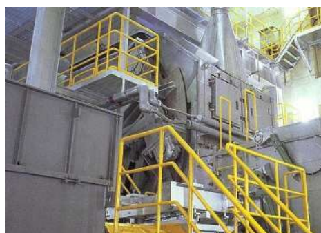
ごみを細かく砕く機械

なごやしのごみを処理しているところだよ。 ごみを燃やしている工場や、ごみを細かく砕いて いる工場を、ぜひ見に来てね