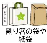
割り箸の袋や 紙袋