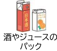
酒やジュースの パック