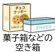
菓子箱などの 空き箱