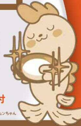
シャチのジュンちゃん