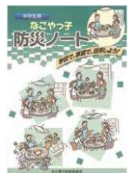
なごやっ子防災ノート

現在、各学校において防災教育で使用している「なごやっ子防災ノート」は、学校だけでなく家庭においても、話し合ったことや大切な事柄を児童生徒が自分なりにまとめることができるように構成されています。防災について指導する際に、「マイ・タイムライン」の趣旨を踏まえながら、より実践的で具体的な避難行動について、児童生徒が意識することができるよう、発達段階や学校の状況等に応じて指導をし、引き続き防災教育の充実を図りました