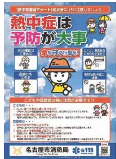
熱中症予防啓発ポスター 2023

また、熱中症予防のため市民が外の暑さを避け一時的に休息できる場所として、「一時的避暑スポット」を設置しました。