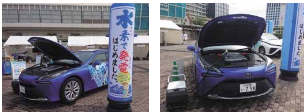
燃料電池自動車の展示及び外部給電の様子

市役所に導入した燃料電池自動車を使用して、イベントや避難所運営訓練で展示及び外部給電の実演等を行い、市民の方に水素エネルギーを身近に感じてもらうとともに、燃料電池自動車の環境面・防災面の有用性について啓発しました。