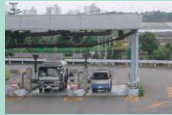
藤前干潟は南陽工場のすぐ目の前♪

干潟体験に加えて、名古屋市で一番大きな焼却工場「南陽工場」を見学！ たくさんのゴミを処理するにはたくさんの工夫や秘密があります…！