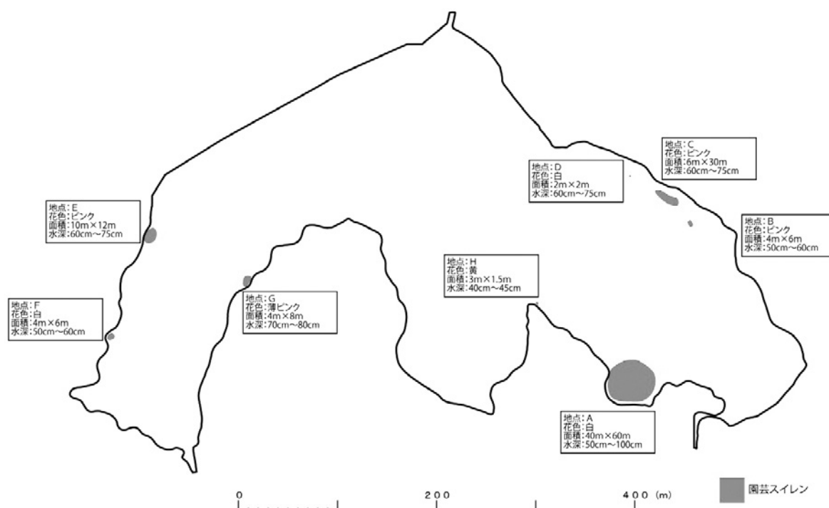
図4. 牧野池における園芸スイレンの分布（2013年6月27日）

人は少なく、牧野池全体を対象とすることが困難であるため、優先順位を設け集中的に除去活動を行っている。除去範囲の選定にあたっては、生育状況調査の結果（図4）をもとに、池岸から生育場所までの侵入経路、水深、除去した園芸スイレンの処分場所、および在来種の生育状況等を考慮した上で判断した。