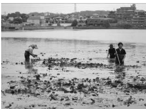
図7. 牧野池における園芸スイレン対策（2014年6月7日）