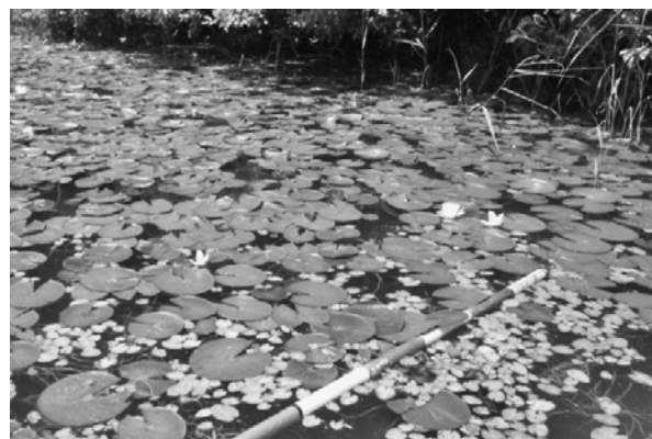
図3. 牧野池に生育するガガブタと園芸スイレン

に「なごや生物多様性保全活動協議会」と「牧野ヶ池緑地保全協議会」が協働で実施した園芸スイレンの生育状況調査（小菅・中村，2014）が始まりである。