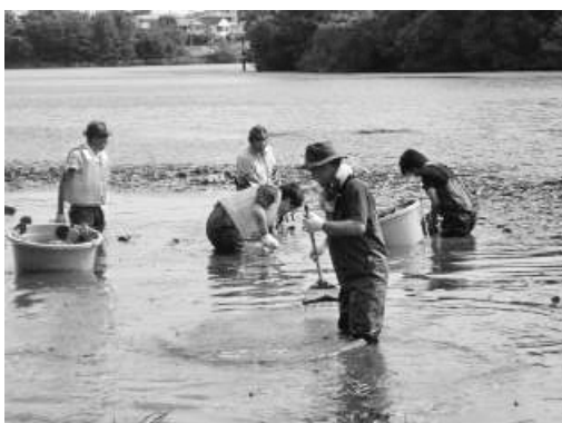
図8. 牧野池における園芸スイレン対策（2014年10月4日）