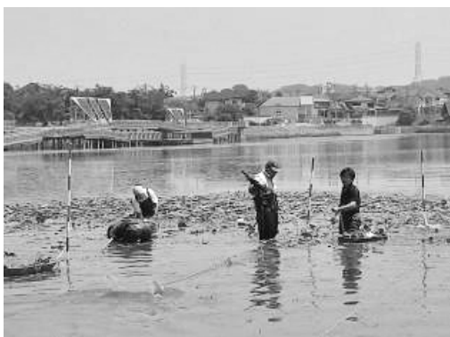
図6. 牧野池における園芸スイレン対策（2014年5月31日）