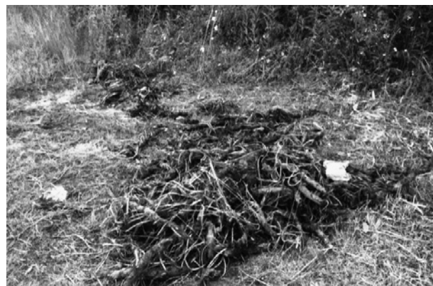
図5. 野積みした園芸スイレン

イなどを用いて池岸まで運搬・陸揚げし、池岸から隣接した場所に設けた平場に野積みし（図5）、枯死させているが、野積みしたことに起因する腐敗臭の問題は、風通しがよく、園路から外れていることもあり生じていない。