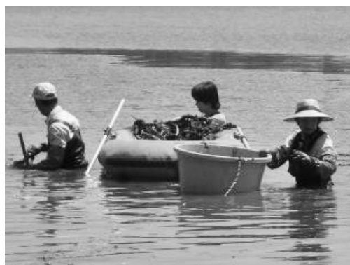
図9. 牧野池における園芸スイレン対策（2015年5月30日）