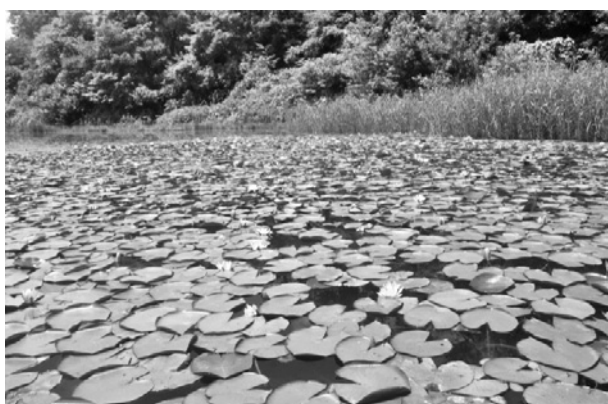
図2. 牧野池で繁茂する園芸スイレン