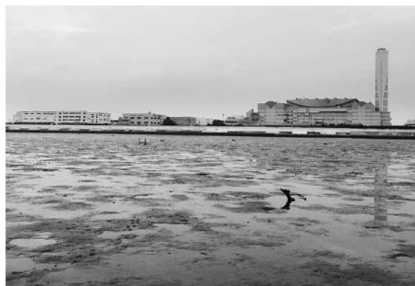
図1. 採集場所付近の風景 (2014年7月13日)

三浦知之. 2008. 干潟の生きもの図鑑, pp.169. 南方新社, 鹿児島.