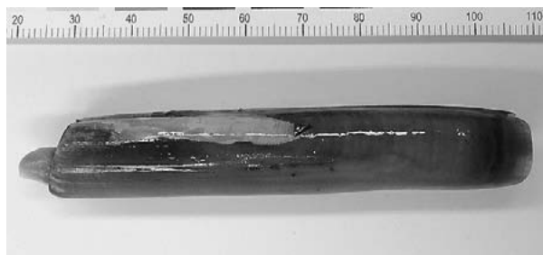
図2. 藤前干潟で採集したマテガイ (2014年7月13日)