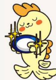
シャチのジュンちゃん