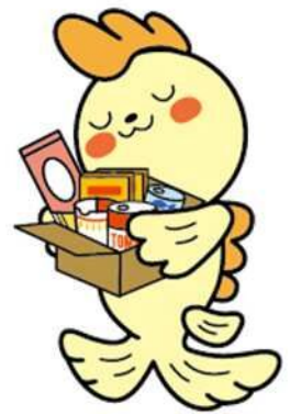
シャチのジュンちゃん