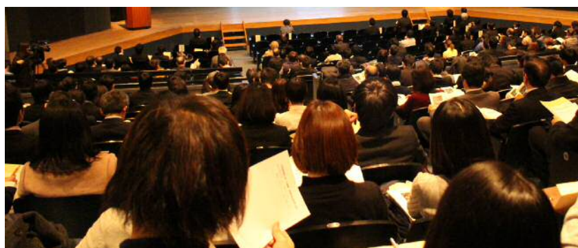
事例発表に熱心に聞き入る参加者のみなさん