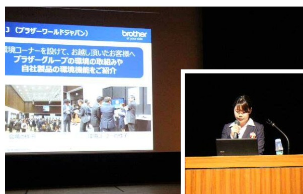
ブラザー販売株式会社本社