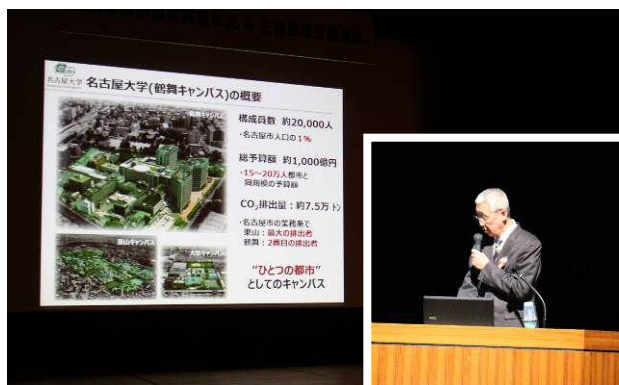
国立大学法人名古屋大学鶴舞地区