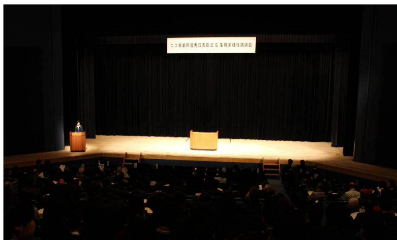
表彰式の会場風景

また、今年度は、事業活動と生物多様性の関わりについて理解を深めるとともに、持続可能な社会づくりについて考える機会とするため、生物多様性講演会も併せて開催しました。会場には、事業者、一般市民等、約350名の参加者が集まりました。