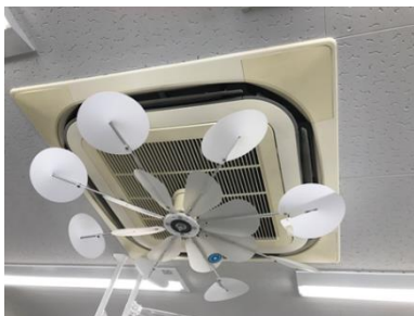
ハイブリッドファン

空調効率の向上のため、ハイブリッドファンを設置。冷氣・暖気を室内の隅々まで循環させて、空調効率を向上させています。