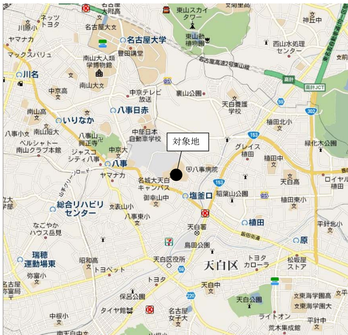
指定区域の周辺の地図