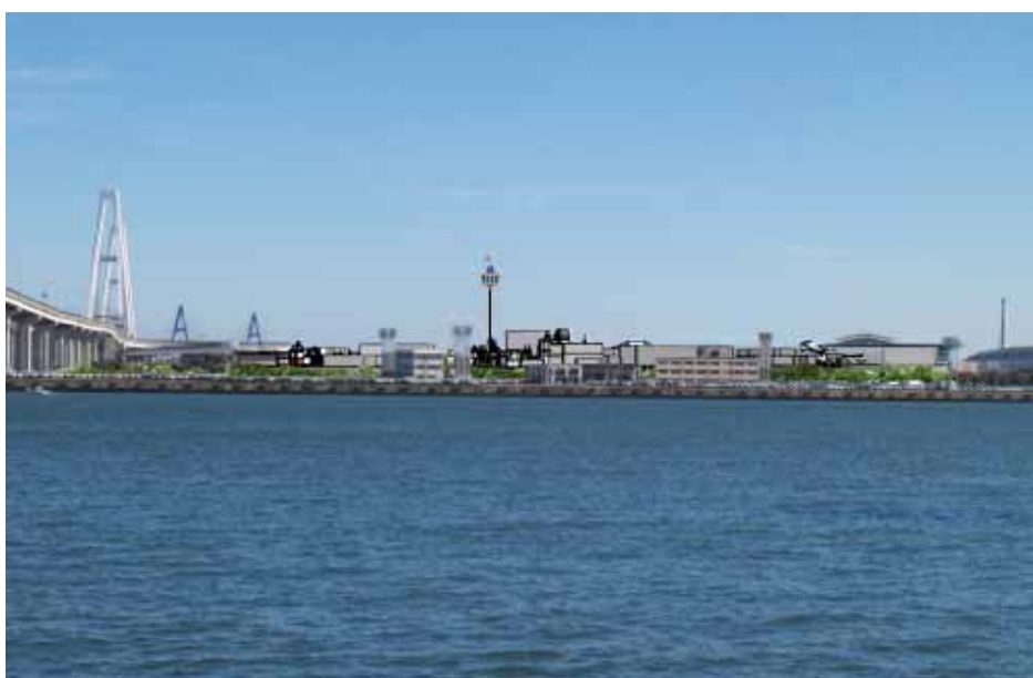
写真 2-6-4 No.2 地点（木場南広場、撮影日：平成 24 年 11 月 10 日）