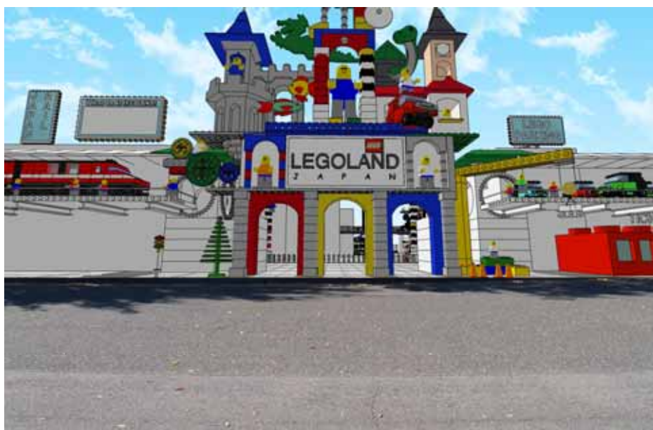
写真 2-6-2 No.1 地点（駐車場前、撮影日：平成 24 年 11 月 10 日）