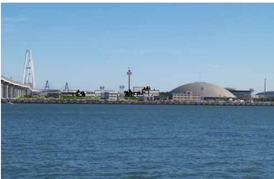
写真 2-6-3 No.2 地点 ( 木場南広場、撮影日 : 平成 24 年 11 月 10 日 )