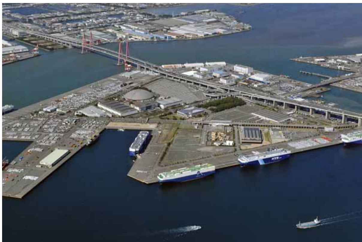
写真 2-6-1 事業予定地及びその周辺の状況(撮影日:平成 23 年 10 月)