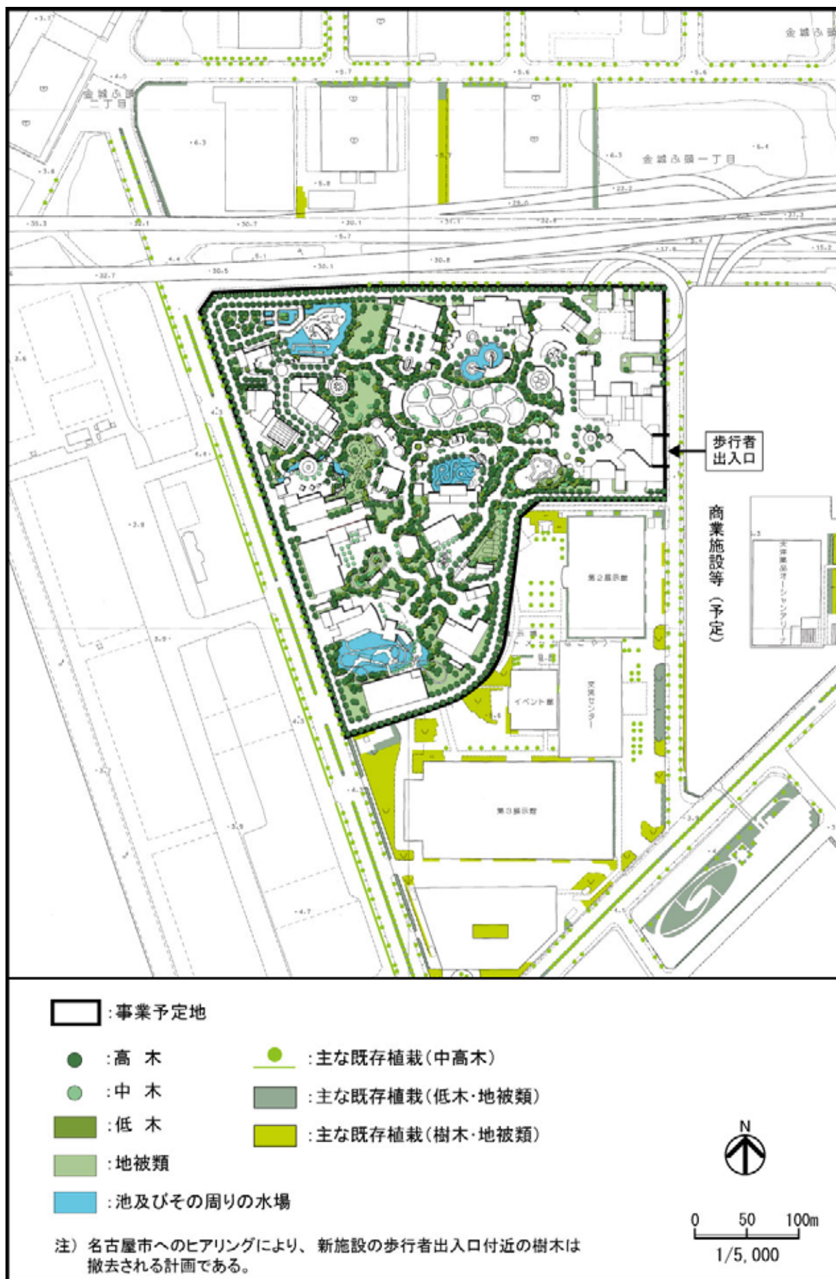
図 2-10-2 緑地等の位置と事業予定地周辺の既存植栽等