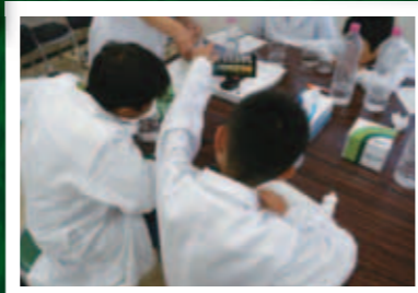
昨年度のかんきょう実験スクールの様子

ミジンコ、ゾウリムシ、ミドリムシ…。聞いたことはあっても実物を見たことはない微生物たち。そんな微生物の体のつくり、食事のようすなどをちょっといい顕微鏡で観察してみましょう。