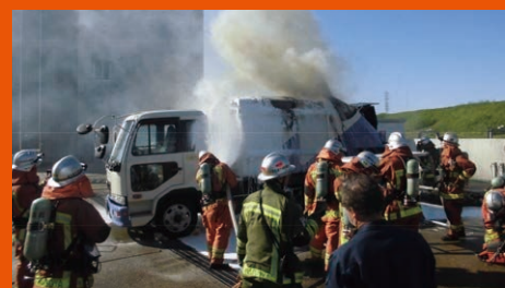
〈ごみ収集車の火災の様子〉

上記の品目を誤って「不燃ごみ」などに 混ぜてしまうと、収集車や工場での火災や 事故につながります。