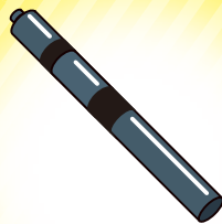
加熱式たばこ・ 電子たばこ