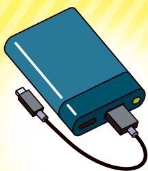
小型充電式電池 (モバイルバッテリーなど)