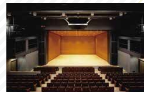
○ 東文化小劇場（併設）

本格的な演劇やダンス公演にも対応できる充実した設備を備えた349席のホール。どの席からも舞台が見やすい傾斜の急な客席も特徴です。