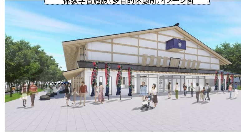
体験学習施設(多目的休憩所)イメージ図

【体験学習施設(多目的休憩所)整備スケジュール】 工期 令和5年度～令和7年度 ※令和5年度に実施設計及び指定管理者選定に向けた調査検討を実施 令和6年度に建設工事着手及び指定管理者の選定を実施