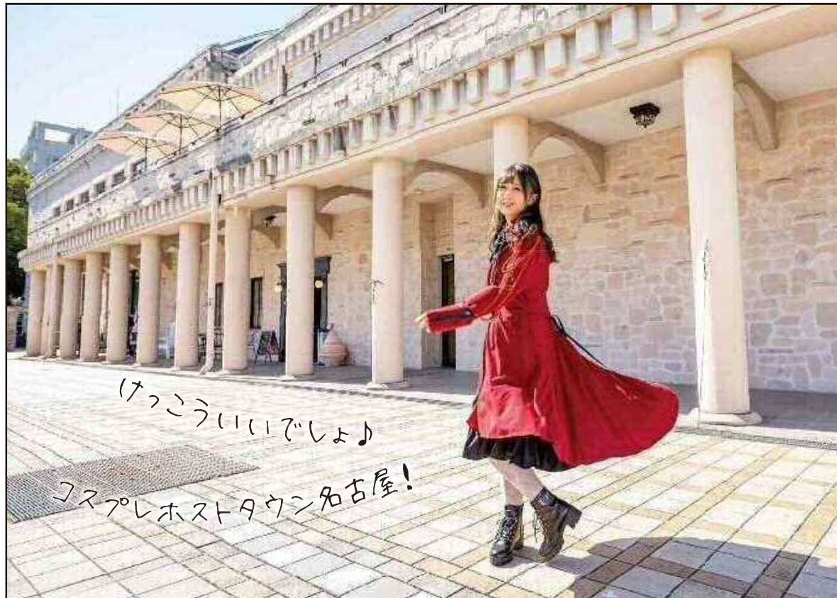
表紙・裏表紙 ロケ地:久屋大通庭園フラリエ(詳細P.7)