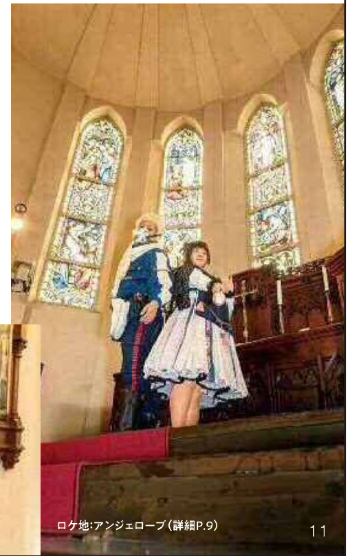
ロケ地:アンジェローブ(詳細P.9)