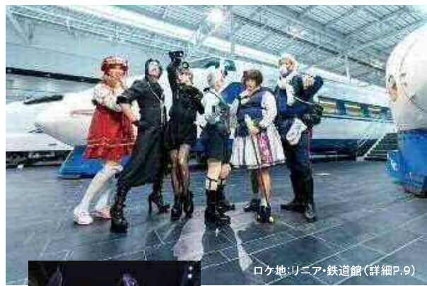
ロケ地:リニア・鉄道館(詳細P.9)