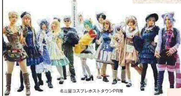
名古屋コスプレホストタウンPR隊