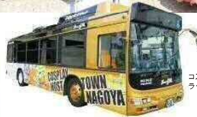
コスプレホストタウンラッピングバス