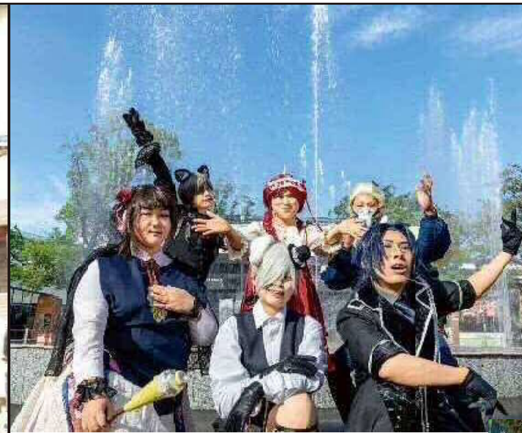
ロケ地:メイカースピア(詳細P.8)