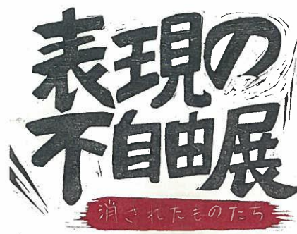
題字ロゴ(木板)：いちむらみさこ 2015年同展ポスターより

「表現の不自由展」は、日本における「言論と表現の自由」が脅かされているのではないかと強い危機意識から、組織的検閲や忖度によって表現の機会を奪われてしまった作品を集め、2015年に開催された展覧会。「慰安婦」問題、天皇と戦争、植民地支配、憲法9条、政権批判など、近年公共の文化施設で「タブー」とされがちなテーマの作品が、当時いかにして「排除」されたのか、実際に展示不許可になった理由とともに展示した。今回は、「表現の不自由展」で扱った作品の「その後」に加え、2015年以降、新たに公立美術館などで展示不許可になった作品を、同様に不許可になった理由とともに展示する。