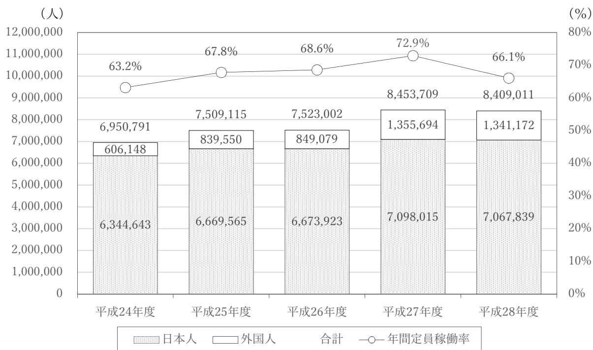
図 2-2-2 市内延べ宿泊者数の推移