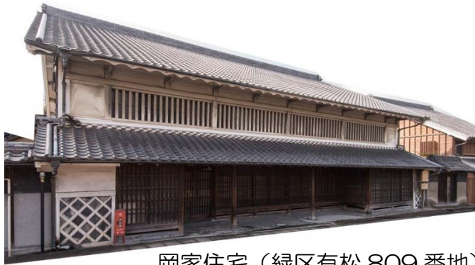
岡家住宅（緑区有松 809 番地）