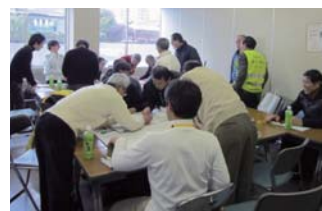
なごや歴まちびとによるワークショップ