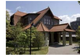
文化のみち二葉館

名古屋城から徳川園に至る一帯を「文化のみち」として育み、「文化のみち二葉館」「文化のみち榎木館」の管理運営や、旧豊田佐助邸・春田鉄次郎邸などの貴重な建築遺産の保存活用を進める。