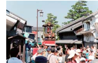
有松の町並みと祭り