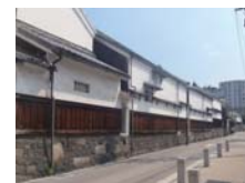
四間道町並み保存地区

市内に残る歴史的な町並みを保存するため、「有松」、「白壁・主税・榎木」、「四間道」、「中小田井」の 4 地区を町並み保存地区に指定し、指導・助言及び補助を行う。