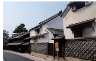
無電柱化による景観の向上