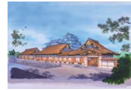
本丸御殿復元イメージ

平成 25 年 5 月 29 日に第 1 期公開（玄関・表書院）を開始。平成 30 年度完成予定。