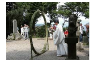
尾張戸神社 茅の輪ぐり