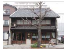
認定地域建造物資産

市内に残る歴史的建造物の周知、及び保存・活用に向けた気運の醸成を図るため、保存・活用の意向が認められる建造物について「登録」「認定」を行う。