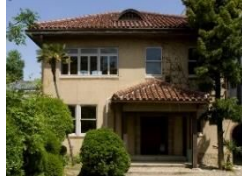
文化のみち榎木館