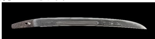
重要文化財 脇指 無銘 貞宗 名物 物吉貞宗

茶の湯道具や刀剣などのうち、名の知られた由緒ある優品は「名物」とよばれ貴ばれました。尾張徳川家の収蔵品を中心として、名物の展開をたどりながら、名だたる名物の数々を御覧いただきます。