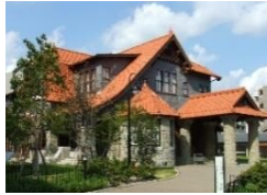
文化のみち二葉館

お屋敷4館に入館してスタンプを集めよう！全て集めた方に先着でプレゼントを呈します。(※旧豊田佐助邸では景品交換ができません。他の3館にてお願いします。)