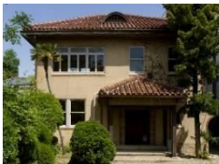
文化のみち榎木館