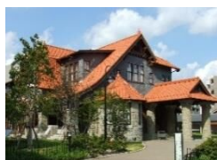
文化のみち二葉館

お屋敷4館に入館してスタンプを集めよう！全て集めた方に先着でプレゼントを進呈します。(※旧豊田佐助邸では景品交換ができません。他の3館にてお願いします。)