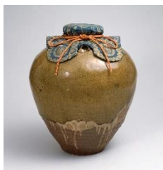
重要文化財 唐物茶壺 銘 松花 大名物

茶の湯道具や刀剣などのうち、名の知られた由緒ある優品は「名物」と貴ばれました。尾張徳川家の収蔵品を中心に名だたる「名物」の数々を紹介します。