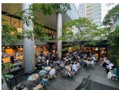
昨年の同イベントの様子

今年で16年目を迎える恒例イベントです！秋の夜、樹木や水盤のある心地よい屋外空間で、飲食しながらゆっくりとジャズをお楽しみください。