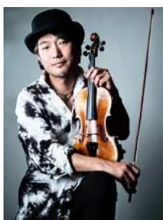
ヴァイオリニスト「高橋誠」