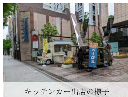
キッチンカー出店の様子

スイーツからランチボックスまで、 色々なキッチンカーが出店しています！ （出店者の詳細はHPをご確認ください）